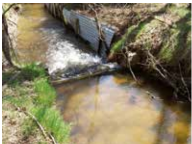
Protection de berge inadaptée