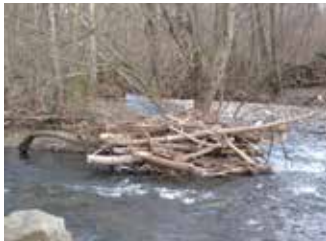
Embâcle de bois

Sinon, l'embâcle peut jouer un rôle positif sur le fonctionnement du cours d'eau (ralentissement de l'écoulement pour limiter les inondations en aval, abri pour la faune).