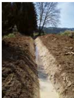
Recalibrage et coupe à blanc