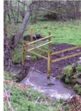
Aménagement d'une zone d'abreuvement pour le bétail

En zone agricole, l'accès direct du bétail au cours d'eau favorise l'érosion des berges par piétinement ; clôturer la parcelle en retrait du cours d'eau et aménager des aires d'abreuvement empierrées permet d'éviter l'érosion.