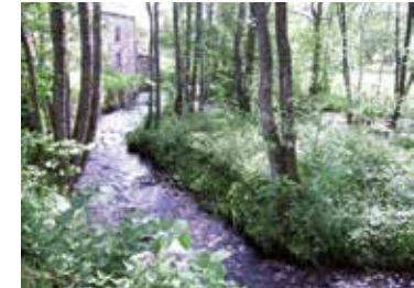
Végétation sur berges

Périodes d'intervention sur les berges : octobre à mars pour la taille, l'élagage et les plantations d'arbres et arbustes ; été pour le fauchage des herbacées.