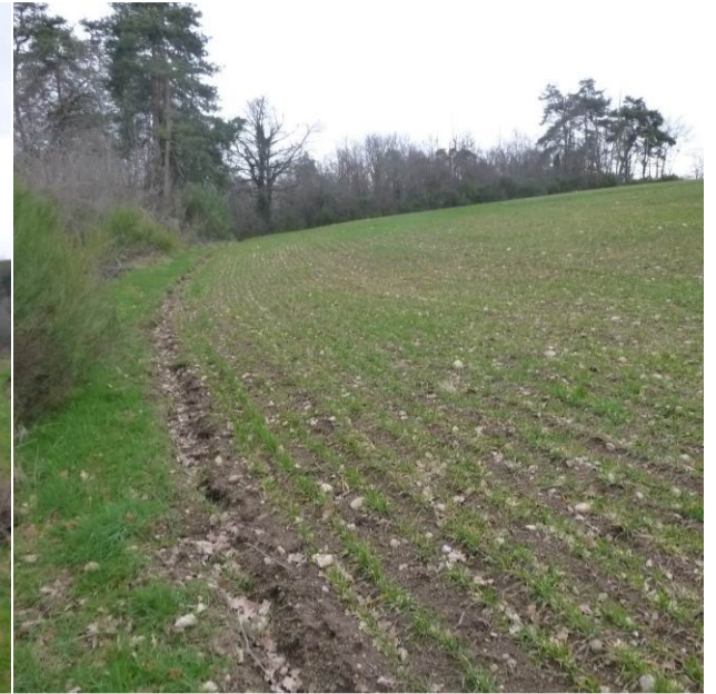
Vue de la limite de propriété Nord