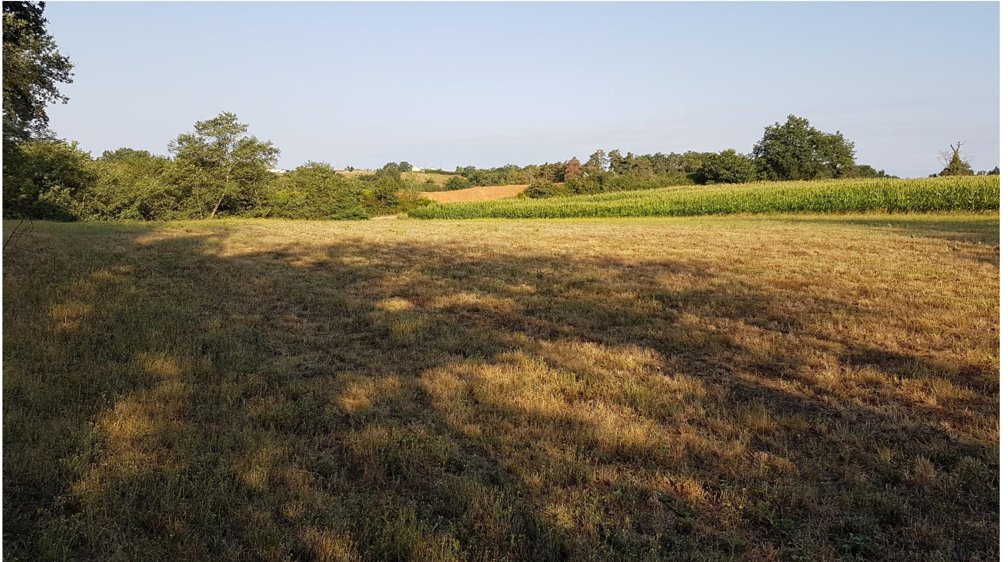
Prairie et culture depuis le repère 6