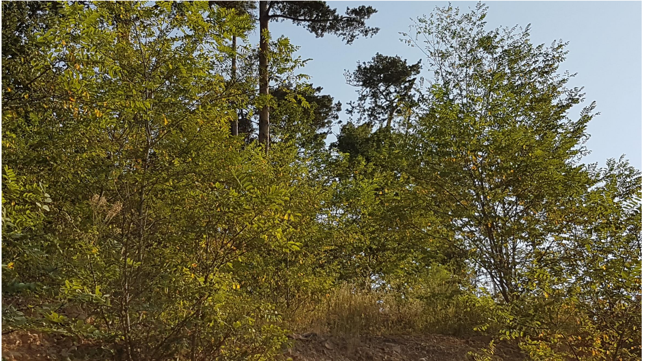
Zone boisée depuis le haut du front de taille, sur le chemin : repère 3