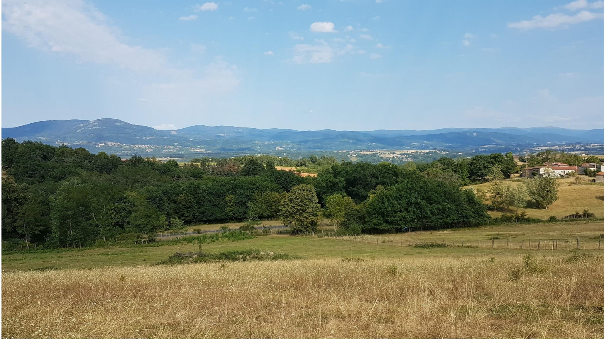
Vue d'ensemble depuis le vallon d'en face, repère 7