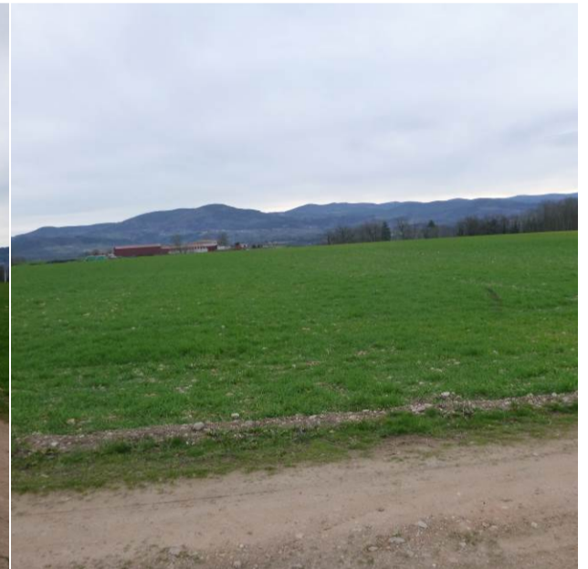
Vue de la limite de propriété Est