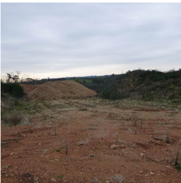
Limite de propriété Est