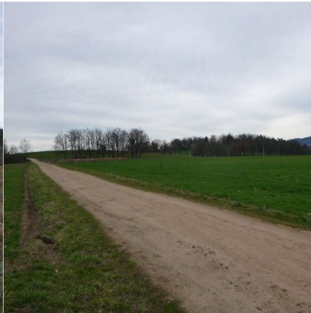
Vue de la limite de propriété Nord-Est