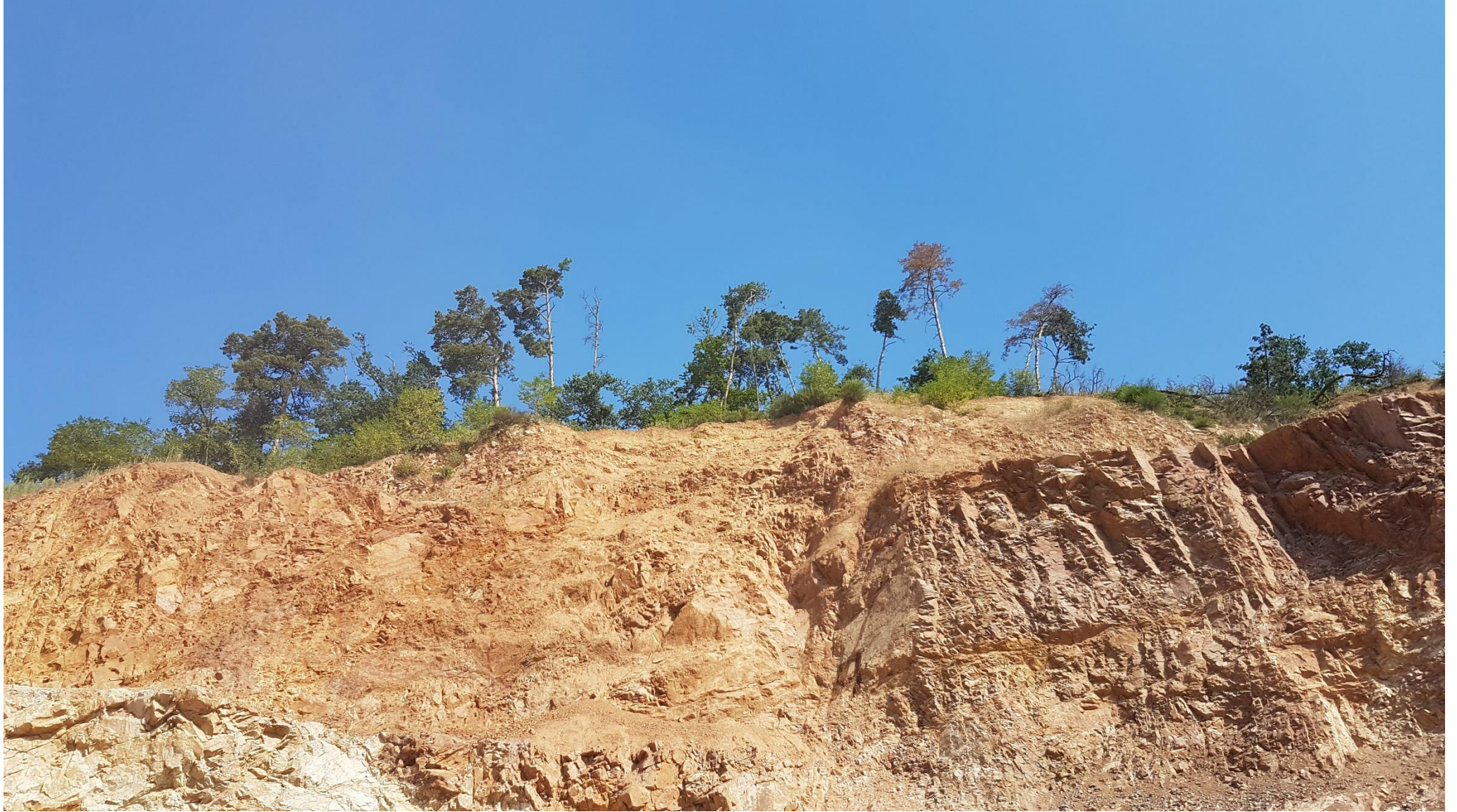
Zone boisée depuis le carreau de la carrière ; repère 4