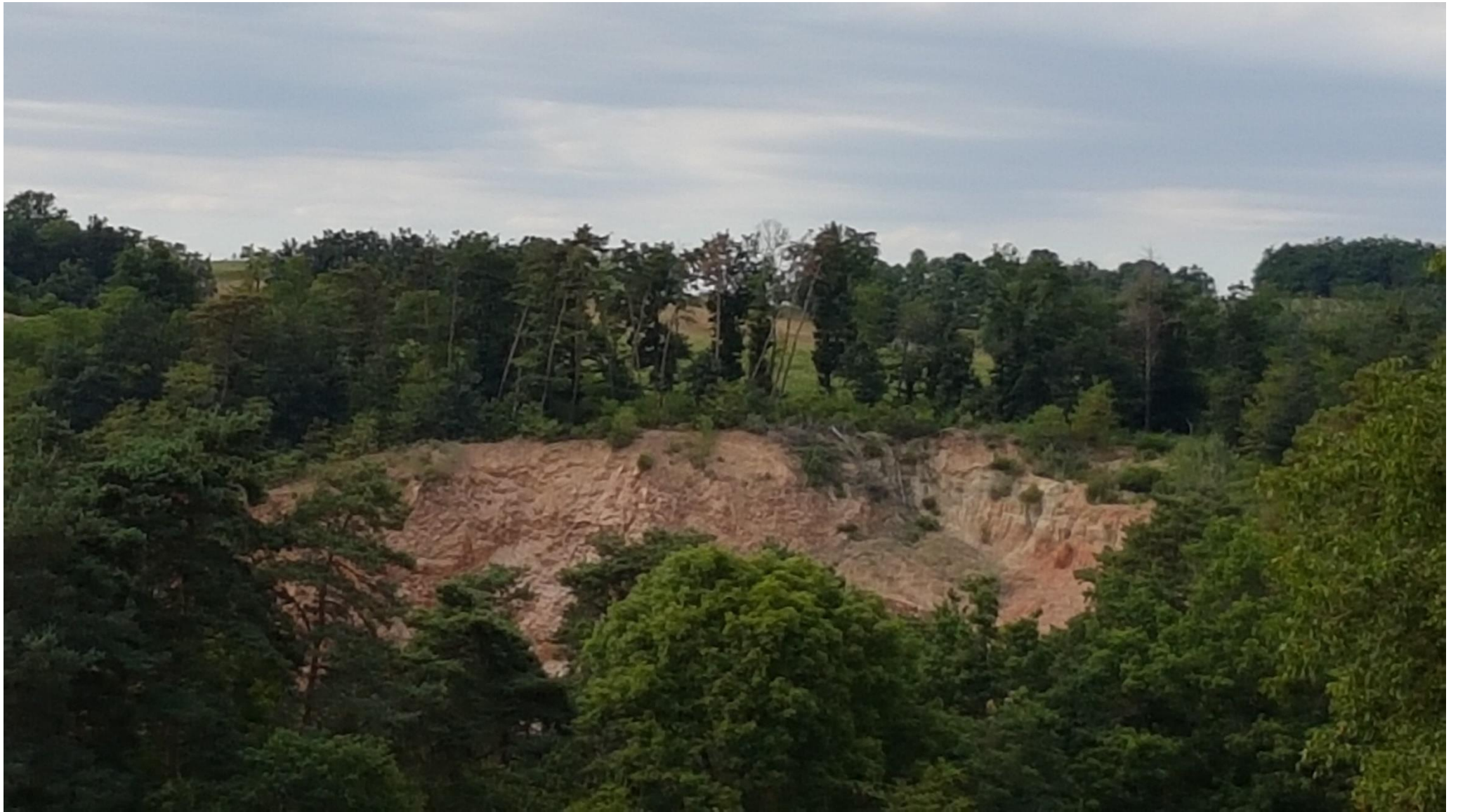
Zoom sur la sone boisée depuis CHAMERLAT, repère 5