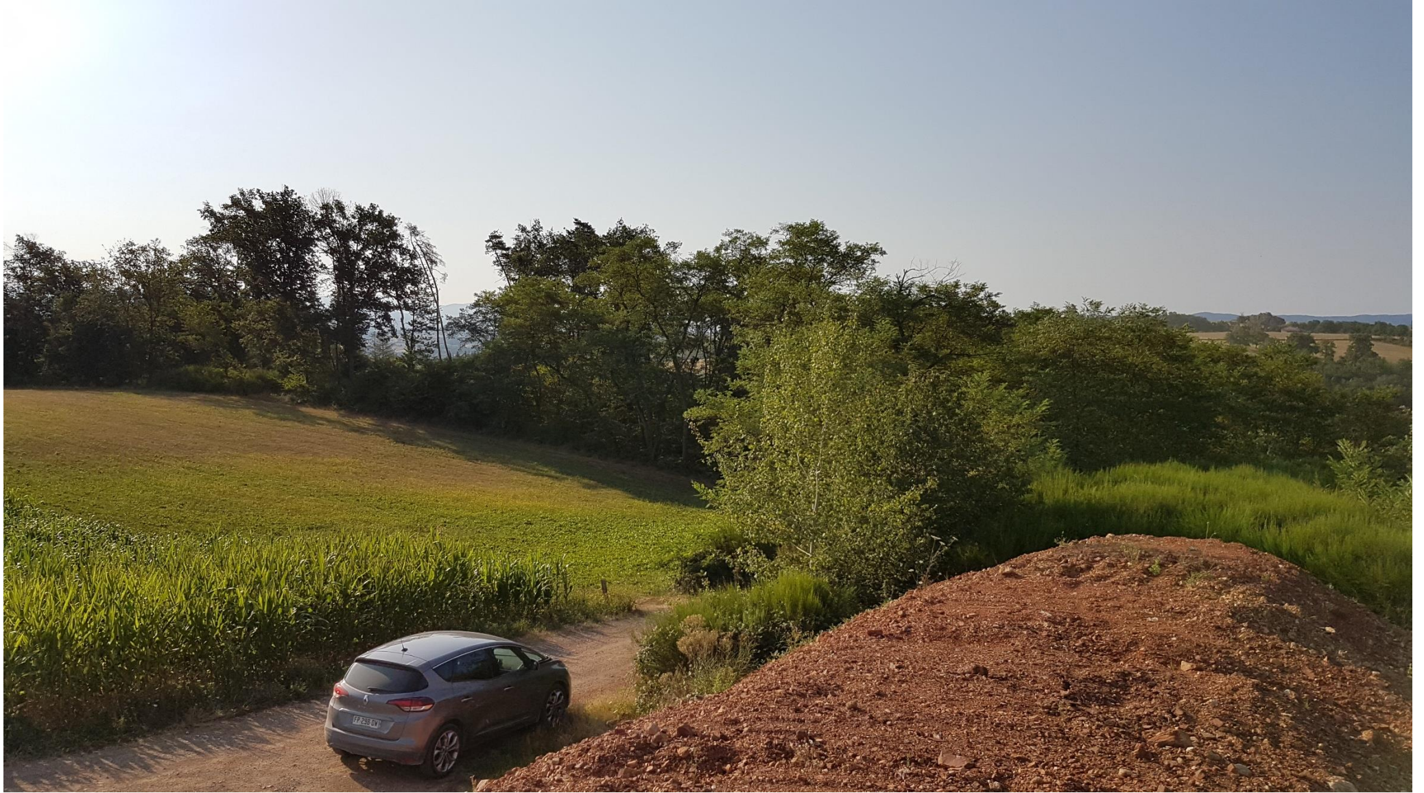
Zone boisée depuis le haut du site, repère 2