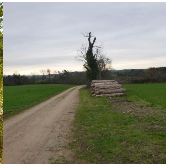
Vue de la limite de propriété Est