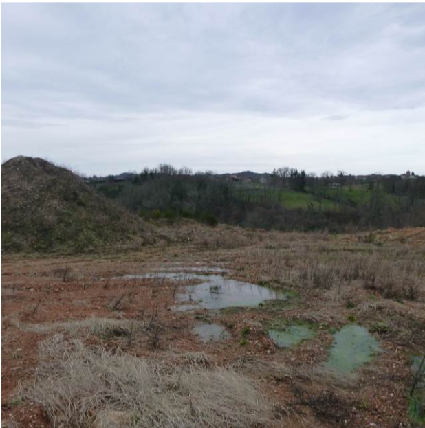
Limite de propriété Est Nord-Est