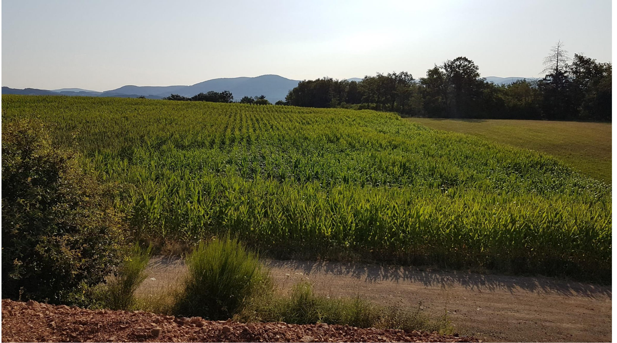
Culture et prairie depuis le repère 2