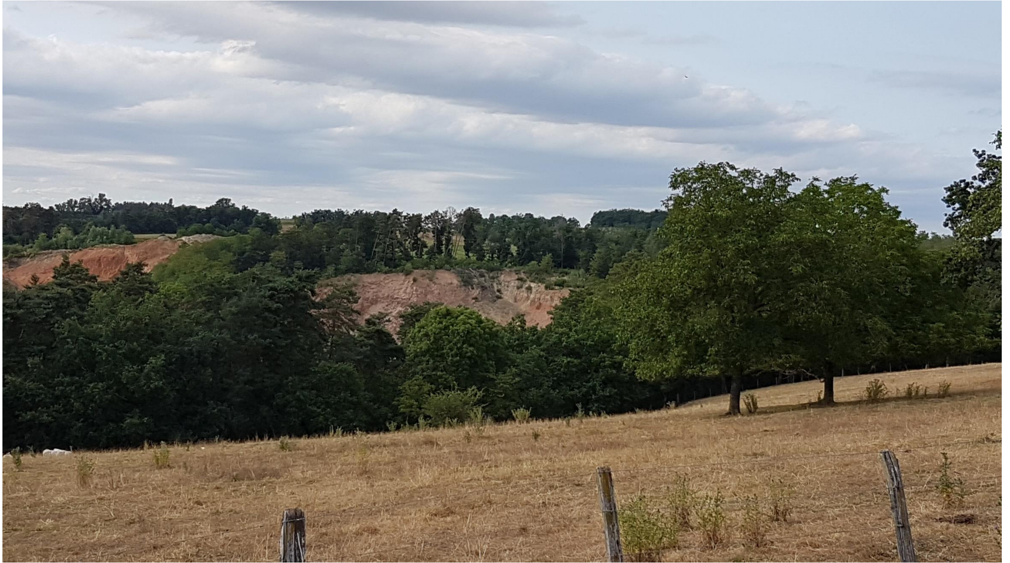
Zone boisée depuis CHAMERLAT, repère 5