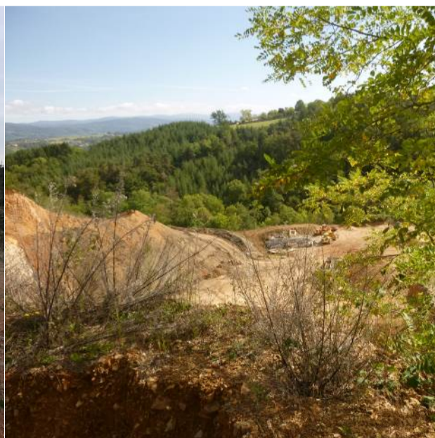
Limite de propriété Sud-Est