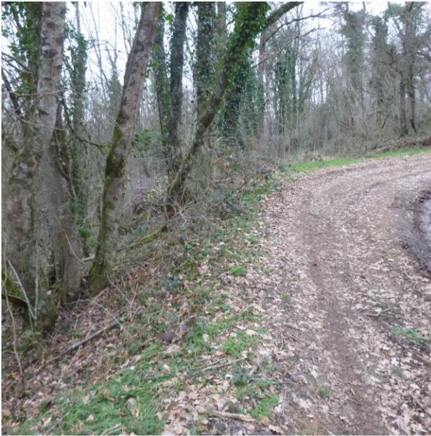
Vue de la limite de propriété Ouest Nord-Ouest