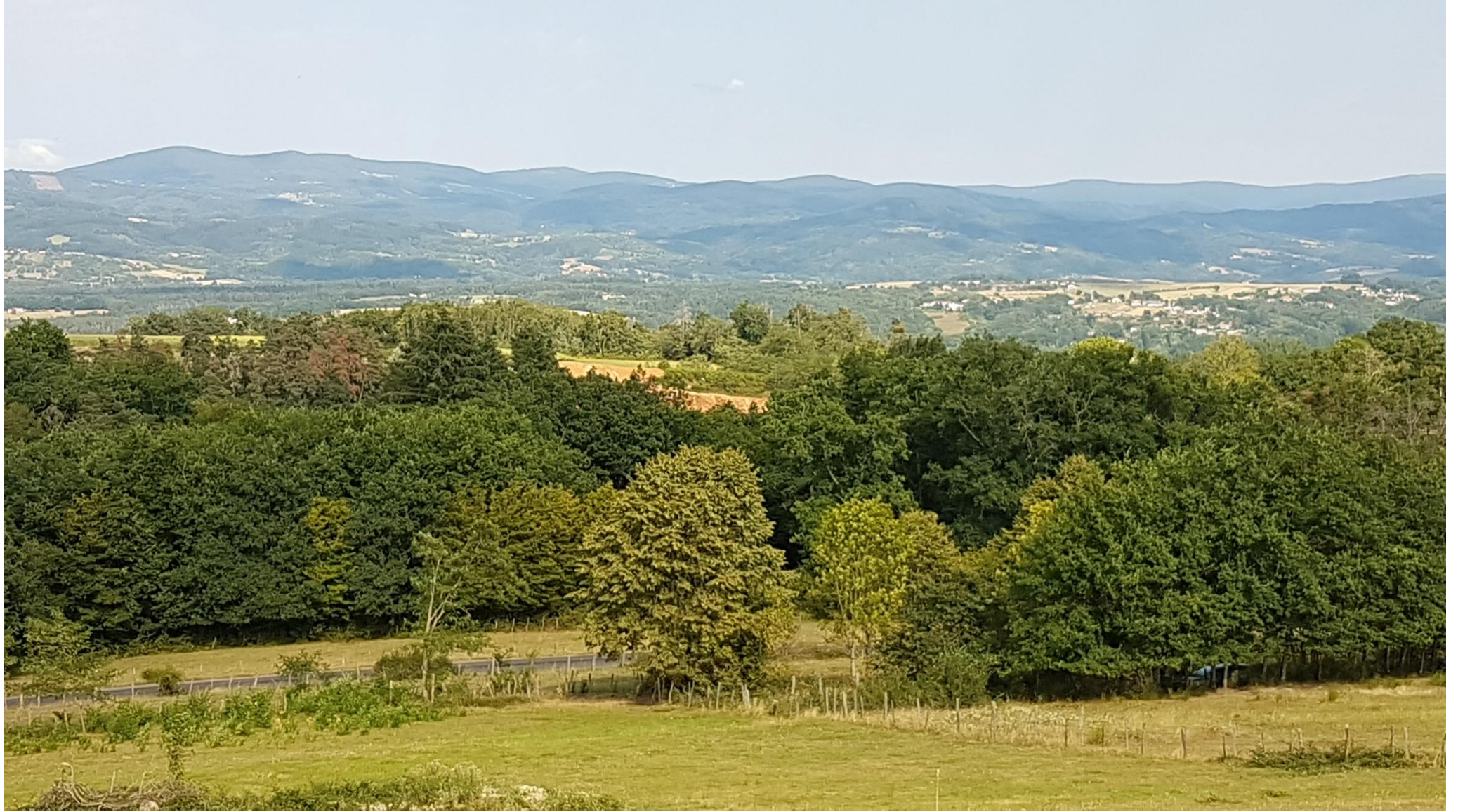
Zoom de la vue d'ensemble depuis le vallon d'en face, repère 7