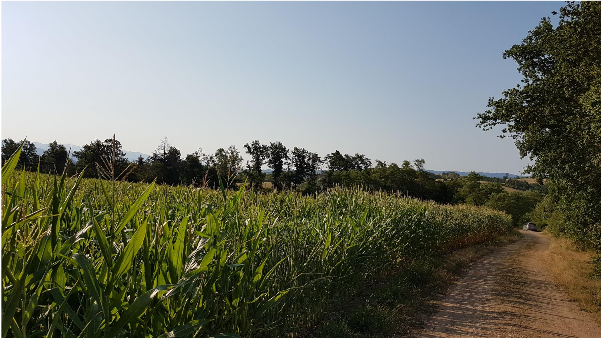
Zone boisée depuis le haut du site : repère 1