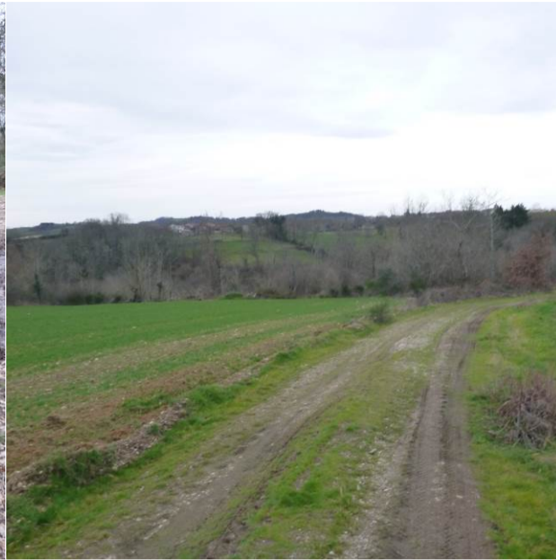
Vue de la limite de propriété Nord-Ouest