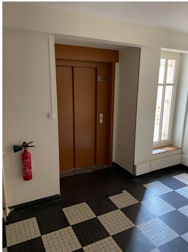
Ascenseur au niveau 0