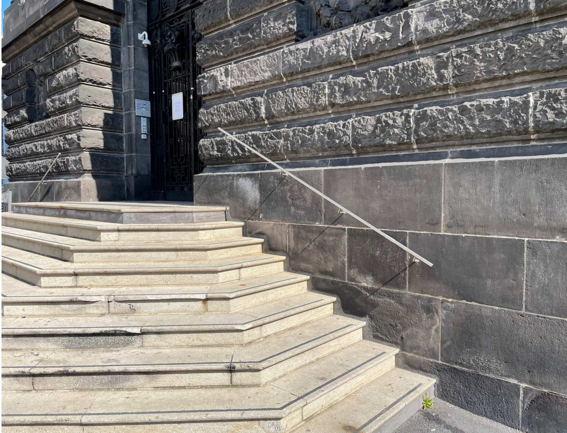
Rampe, nez de marches antidérapants, première et dernière contre-marches de couleur différente.