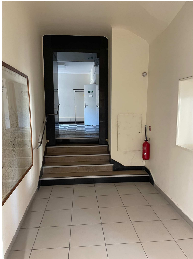
Escalier menant à l'ascenseur avec nez de marches antidérapants, première et dernière contre-marches de couleur différente.