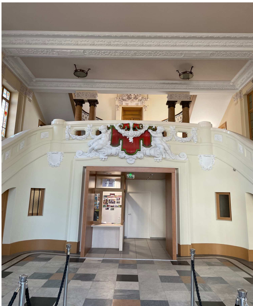
Accès à l'ascenseur à droite de la loge du gardien.