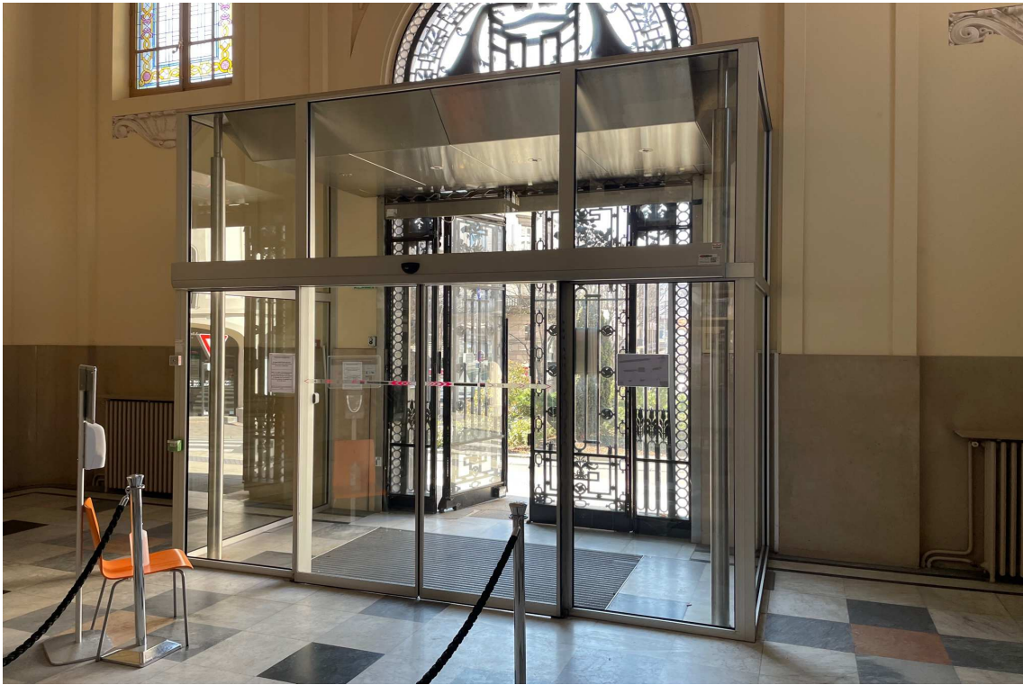
Entrée du bâtiment par un sas sécurisé.