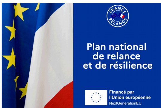
Plan national de relance et de résilience (PNRR), plan NextGenerationEU

Le plan national de relance et de résilience (PNRR), présenté par la France à l'Union européenne, a été validé en juillet 2021. Il permet de financer à hauteur de 40 %, les 100 milliards d'euros du plan France relance.