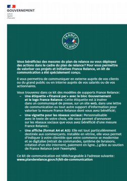
Le kit de communication France Relance

Vous bénéficiez des mesures du plan France Relance ou vous déployez des actions dans ce cadre ?