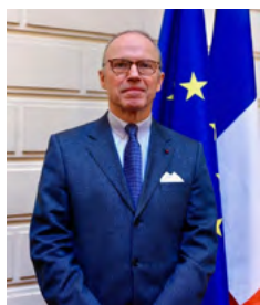
Pascal Mailhos, préfet de la région Auvergne-Rhône-Alpes, préfet du Rhône

Présenté le 3 septembre 2020, le plan de relance se déploie aujourd'hui sur notre territoire, avec de premiers effets concrets. Nous pouvons d'ores et déjà nous féliciter que notre région y figure à sa juste place, tant dans