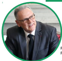
Philippe CHOPIN, Préfet du Puy-de-Dôme

Depuis le lancement du plan de relance le 3 septembre 2020, les services de l'État se consacrent à la relance de l'économie dans le Puy-de-Dôme, en partenariat avec les entreprises, les chambres consulaires et les collectivités locales. La relance économique constitue en effet une occasion unique de décarboner l'économie de notre territoire, de soutenir les dynamiques d'innovation et de sauvegarder nos emplois. Notre département recèle par exemple un potentiel exceptionnel dans le domaine industriel, qui a d'ores et déjà permis à plusieurs entreprises de remporter des appels à projets France Relance. De telles réussites doivent être mises en avant et connues de nos concitoyens.