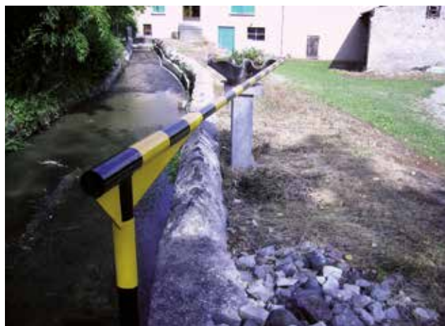
Cas de non respect de la zone non traitée