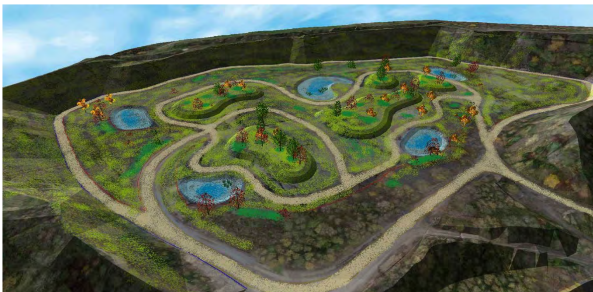
Aperçu de la remise en état en vue oblique depuis le nord-ouest du projet