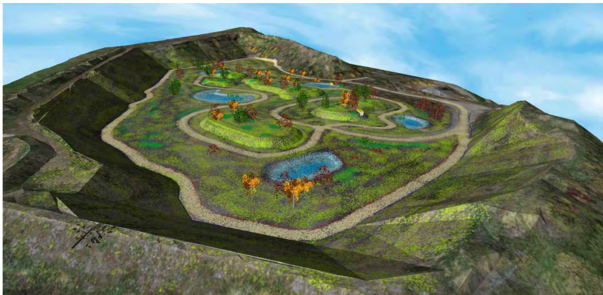
Aperçu de la remise en état en vue oblique depuis le nord du projet

Les figures ci-dessous présentent des vues obliques du réaménagement du site projeté.