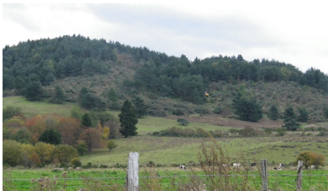
AVANT (coupe en cours)

La coupe rase d'une parcelle n'est pas un défrichement lorsqu'elle est suivie d'un reboisement, artificiel ou naturel.