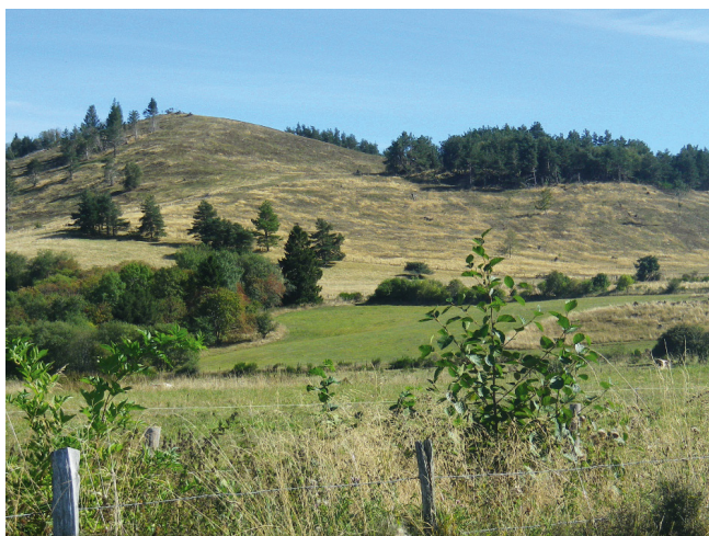
APRES (terrain pâturé)