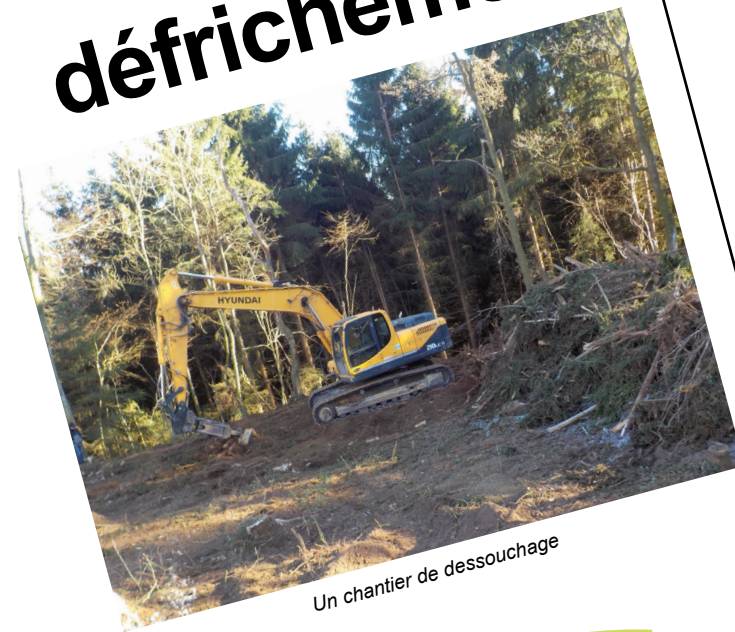
Un chantier de dessouchage

Ce document s'adresse aux particuliers, professionnels et collectivités qui souhaitent réaliser un défrichement de leur bois ou forêt.