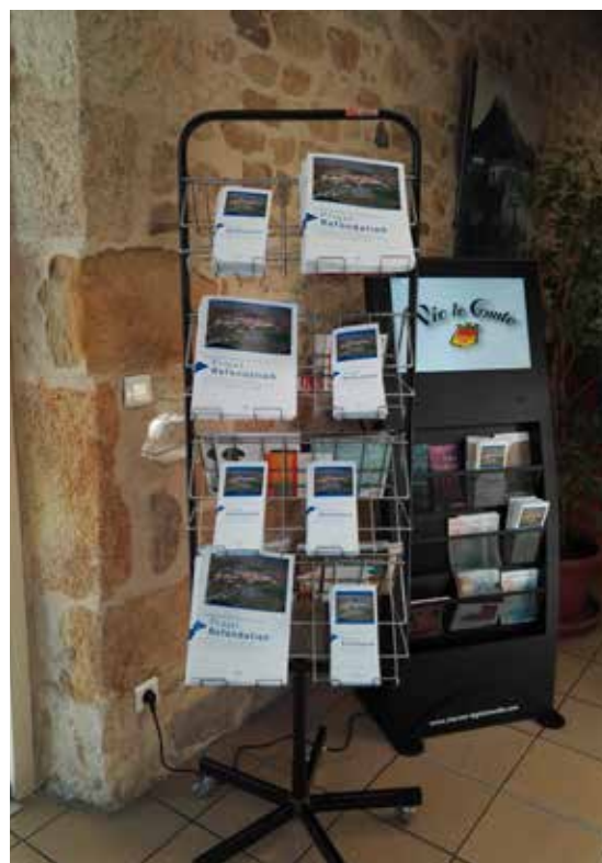
Dépliants et dossiers de présentation du projet Refondation disposés en mairie