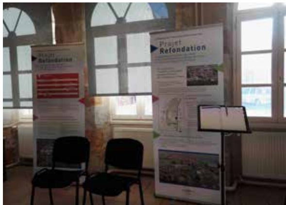
Kakémonos exposés en mairie et registre papier