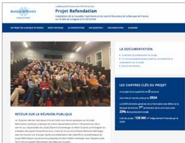
Capture d'écran du site internet dédié au projet