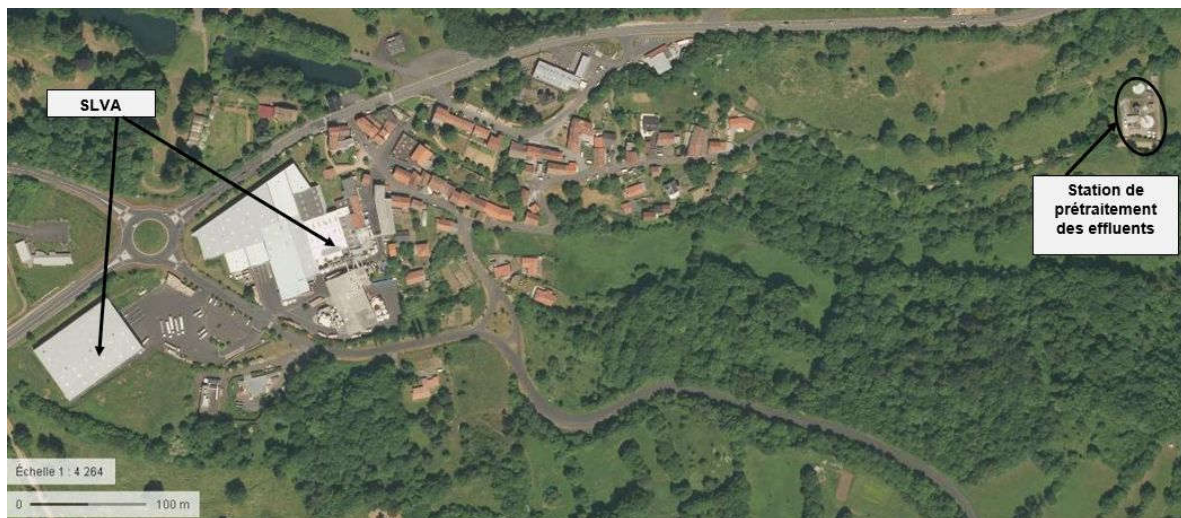
Carte 4 : Vue aérienne du site et du dispositif de prétraitement des effluents

La vue aérienne ci-dessous localise le site et sa station de prétraitement.