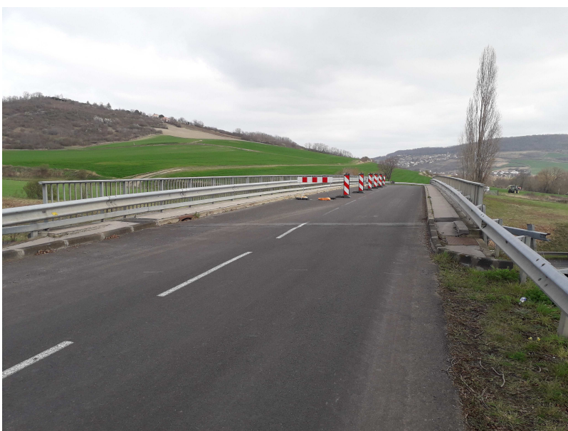
Ouvrage d'art PS9 permettant la traversée de l'A75 par la RD8

Les travaux prévus font suite à un accident survenu durant le mois d'août 2020.