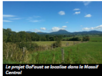
Le projet GoFaust se localise dans le Massif Central

Développement d'une énergie avec un impact foncier très faible et une durabilité de la ressource supérieur à 50 ans.