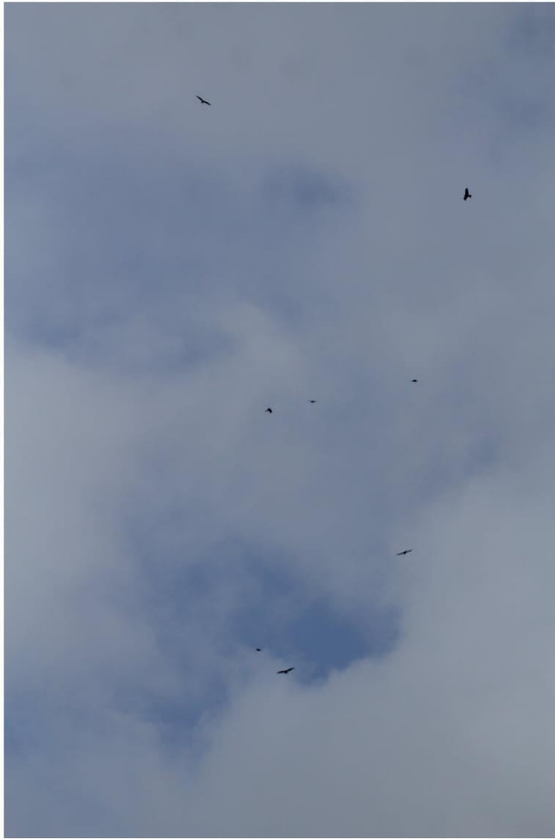
Photo des milans royaux au dessus de Prades.

La population de milans royaux est largement sous évaluée par l'étude !