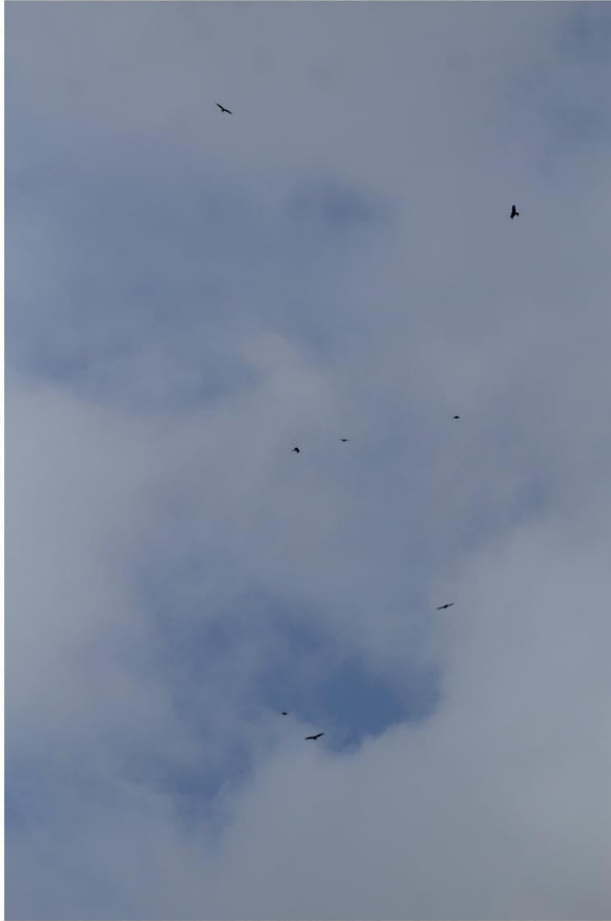
Photo des milans royaux au dessus de Prades.

La population de milans royaux est largement sous évaluée par l'étude !